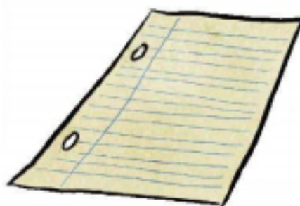
feuille de papier