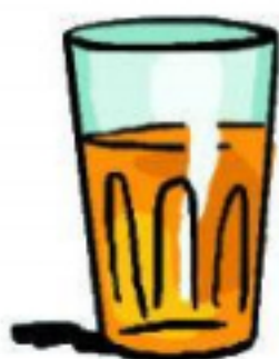
jus de fruits